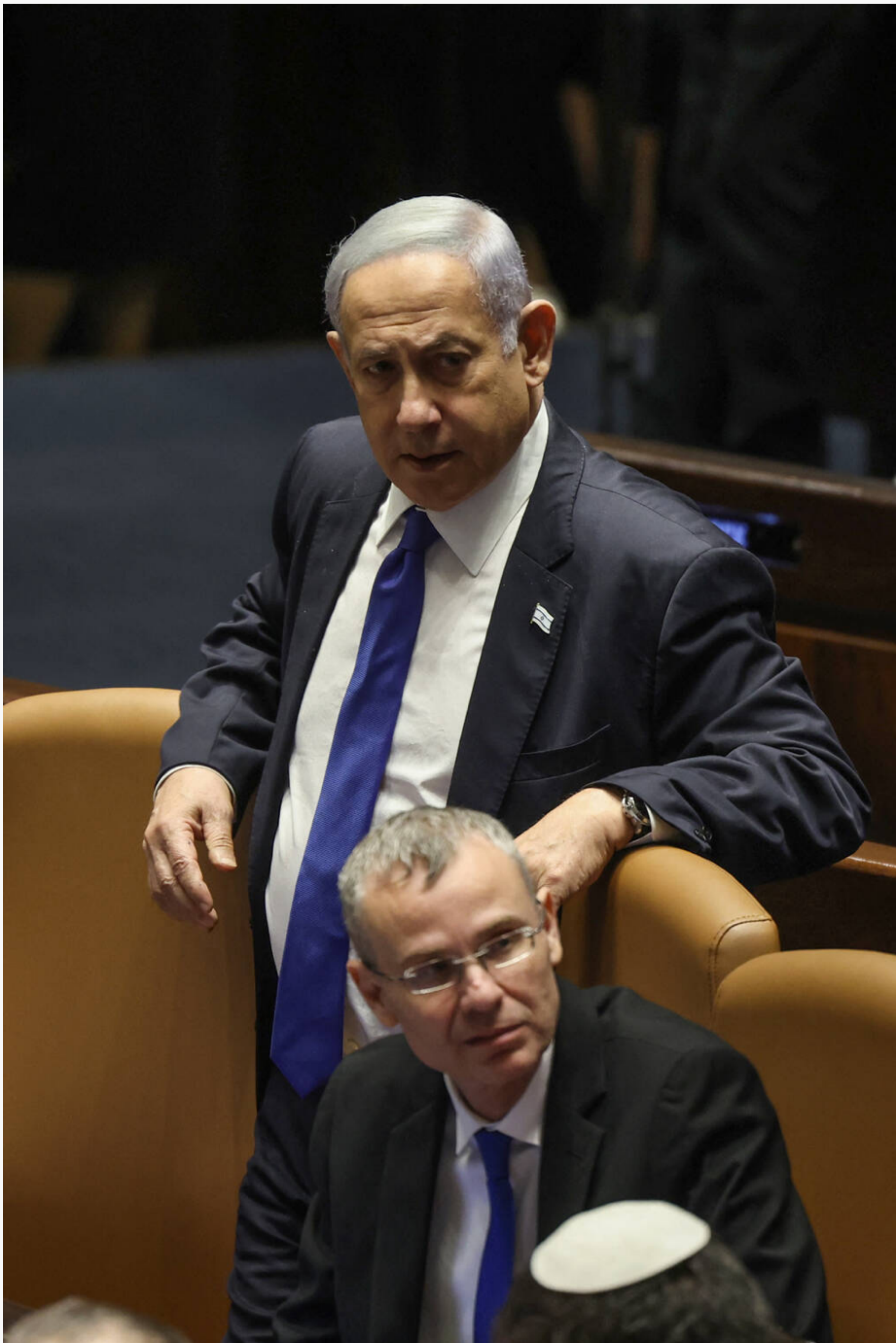
Benjamin Nétanyahou et le ministre de la Justice Yariv Levin au Parlement lors du vote de la refonte judiciaire, à Jérusalem, le 24 juillet 2023.

Tout occupé à mener un coup d’Etat judiciaire, le Premier ministre ne s’est, en réalité, que très peu préoccupé de la sécurité d’Israël. Il porte la responsabilité dans l’échec de son armée face à l’attaque du Hamas le 7 octobre, estime la sociologue franco-israélienne.