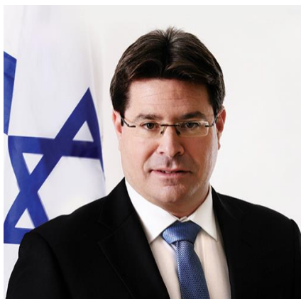
Likoud Ofir Akunis Ministre de la science et de la technologie

Au précédent gouvernement, M. Akunis a été suggéré en tant que ministre de la Justice après que la Cour suprême a exigé que le poste vide de pouvoir du Ministre de la justice soit pourvu dans les 48 heures. Le procureur général Avichai Mandelblit et la Cour suprême israélienne ont déclaré un vote au sein du cabinet sur cette nomination. M. Akunis a affirmé que les Palestiniens sont l'obstacle au processus de paix ( Héb ).