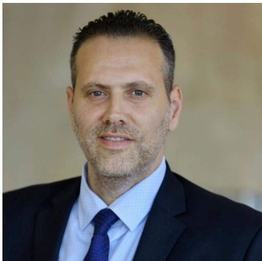
Likoud Makhluf "Miki" Ministre de la culture et des sports

Le Premier ministre Netanyahu a menacé de la relever (de ses fonctions ), alors que la réforme suscitait des manifestations de masse . Gallant a maintenu sa position et a finalement voté en faveur de la réforme, contrairement à ses objections antérieures.