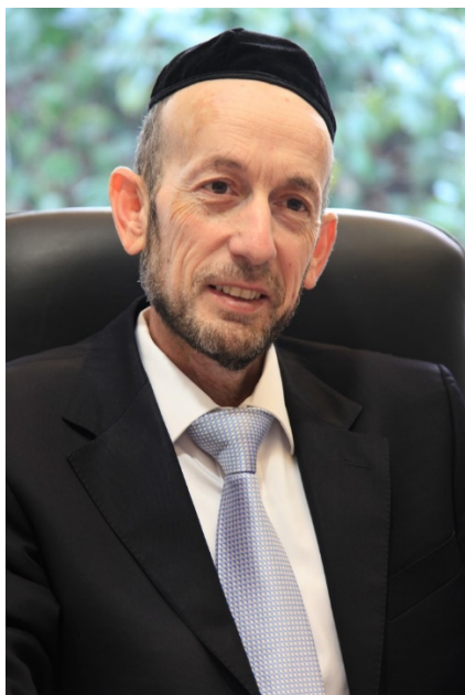
Judaïsme de la Torah uni Uri Maklev Vice-Ministre des transports

"Ils [ les Juifs réformateurs ) ont causé le plus grand mal au peuple juif. Des millions de Juifs se sont mariés de leur propre initiative dans le cadre de mariages mixtes et ne font pas aujourd'hui partie du peuple juif » ( Maklev, 2017 )