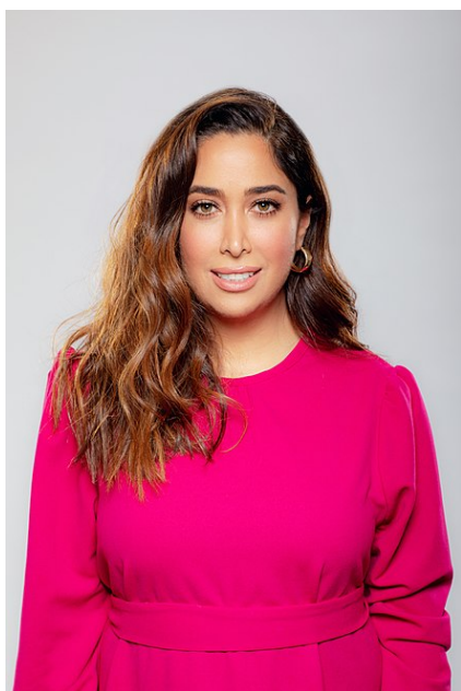
Likoud Mai Golan Ministre de la promotion de la condition de la femme

"Ils [ les Juifs réformateurs ) ont causé le plus grand mal au peuple juif. Des millions de Juifs se sont mariés de leur propre initiative dans le cadre de mariages mixtes et ne font pas aujourd'hui partie du peuple juif » ( Maklev, 2017 )