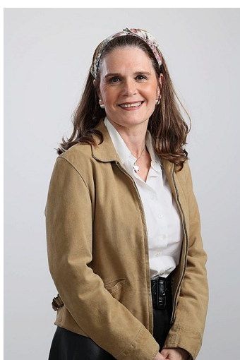
Le sioniste religieux Michal Waldiger Vice-Ministre des finances

En novembre 2021, il a reconnu sa culpabilité , bénéficiant d'une probation et d'une amende de 20 000 dollars.