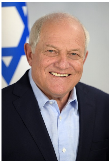
Likoud Haim Katz Ministre du tourisme

Forbes a rapporté que la valeur nette de Katz est d'environ 7,8 millions de dollars, le classant parmi les huit plus riches hommes politiques israéliens. Lors des élections primaires du parti du Likoud de 2003, les transactions financières de Katz ont suscité des inquiétudes. Les employés présumés de l'industrie aérospatiale impliqués n'ont pas auto-financé leurs honoraires mais ont utilisé une association en faveur des travailleurs salariés en territoire israélien géré par Katz, ce qui pourrait enfreindre la loi sur le financement des partis. Bien que la police ait recommandé l'acte d'accusation ( Heb ) en 2006, le Procureur général Mani Mazuz a abandonné l'affaire en 2007, citant un manque de preuves. Katz a fait face à une série d'allégations et d'enquêtes , y compris la coercition, le délit d'initié, la corruption et la soustraction .