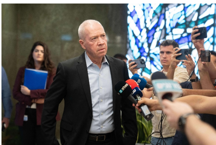
Likoud Yoav Gallant Ministre de la défense

En mai 2022, Distel-Atbaryan a affirmé dans une interview qu'« il n'y a pas d'autisme », et a partagé comment elle « a traité » son fils autiste, en lui tirant sur ses cheveux et en lui refusant de la nourriture et de l'eau jusqu'à ce qu'il parle. Les commentaires ont provoqué l'agitation et ont conduit à des critiques de la part des personnes autistes et de leurs familles ( Héb ).