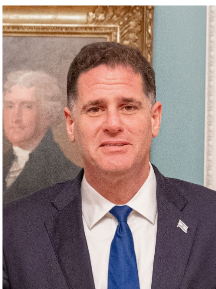
Likoud Ron Dermer Ministre des affaires stratégiques

Au précédent gouvernement, M. Akunis a été suggéré en tant que ministre de la Justice après que la Cour suprême a exigé que le poste vide de pouvoir du Ministre de la justice soit pourvu dans les 48 heures. Le procureur général Avichai Mandelblit et la Cour suprême israélienne ont déclaré un vote au sein du cabinet sur cette nomination. M. Akunis a affirmé que les Palestiniens sont l'obstacle au processus de paix ( Héb ).