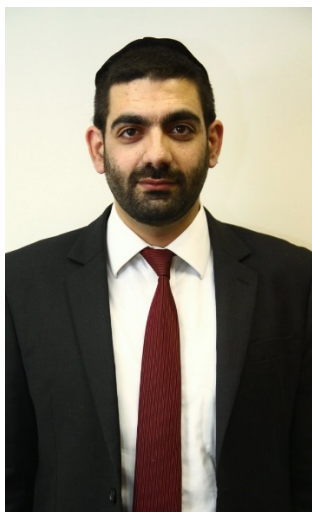
Shas Michael Malchieli Ministre des cultes

En 2022, Mme Strook suggère que les médecins pourraient refuser de traiter les homosexuels si cela est en conflit avec leurs croyances religieuses.